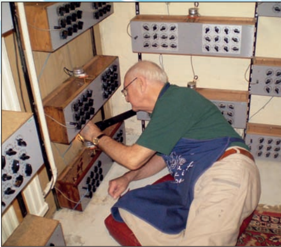
I gamle dage var der meget manuelt arbejde med de op til 800 apparater.