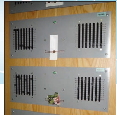
Akutapparaterne, hvor klientens bloddråbe placeres forrest, har helt særlige rater, fx mod en akut betændelsestilstand. Alt kan behandles, fx har en moderate mod dræbersnegle (lille foto, nederst) rensset området for disse. - Et blad fra en lusebefængt rose har fjernet lusene. - Et billede af jordkloden, og her er raten fred.

kvenssprog - et slags maskinsprog, som giver en præcis energibehandling hver gang. Et sprog, som alle kroppens celler forstår. På rette sted, på rette tid, i den rette dosering, nøje indrettet efter kroppens tilstand og bevidsthedens udviklingstrin og skæbne. Derfor kan radioni ikke give bivirkninger og heller ikke overdoseres.