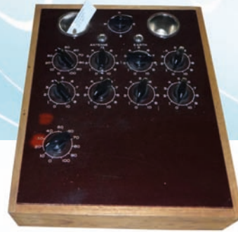
På de allerførste apparater indstillede man op til seks frekvenser ad gangen, og kun én klient kunne behandles ad gangen.