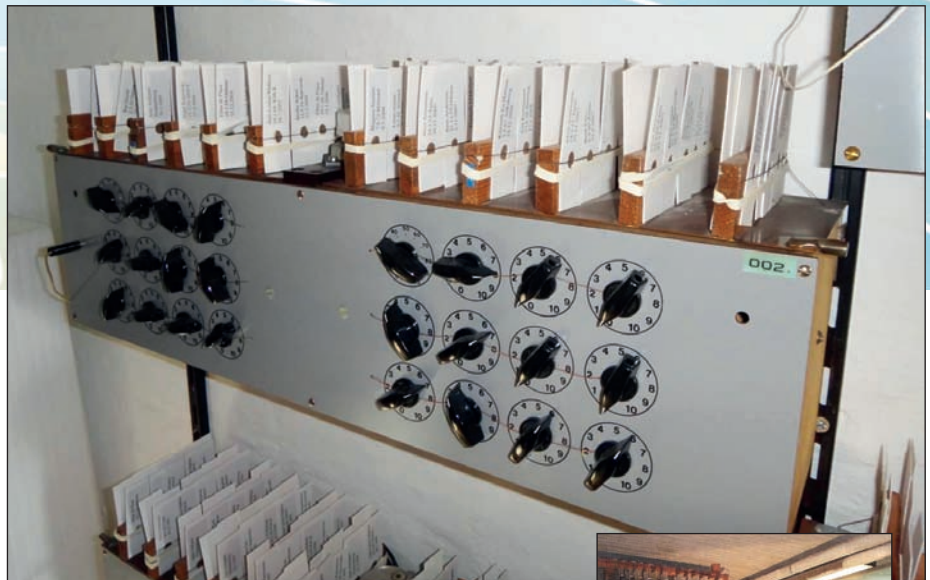
Tidligere var hvert apparat indstillet til ét område i kroppen, fx bihuler. Hver klients bloddråber stod derfor ovenpå flere apparater. To gange i døgnet skulle alle bloddråberne flyttes til næste apparat.

”En mand kom her med stadig stigende demens og Parkinson. Han var hyret til at holde et foredrag seks måneder senere, og det kunne umuligt lade sig gøre på det tidspunkt. Efter tre måneders behandling og ændrede kost-/tilskudsvaner var alle gamle infektioner og de fleste toksiner væk. Seks måneder senere gennemførte han sit foredrag om forhandlingsteknik i Asien.”