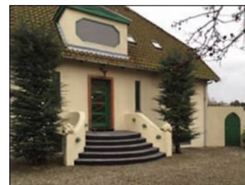
De Place Laboratoriet i Birkerød er grundlagt i 1975.

og giver dermed mulighed for at påvirke kroppens energisystemer hurtigere og mere effektivt end i radioniens barndom.